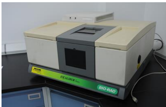
电性能测试实训室