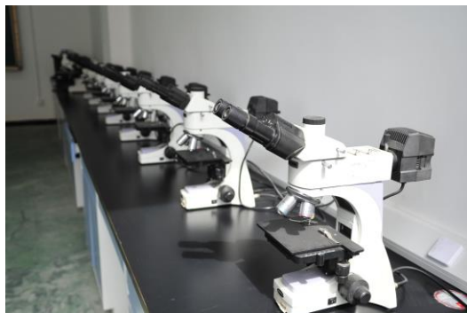
晶体结构分析实训室