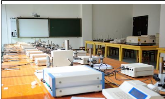
电性能测试实训室