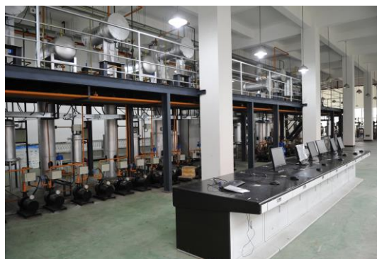
多晶硅生产虚拟仿真实训室