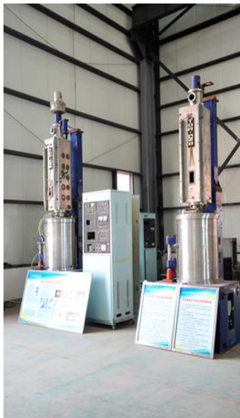
直拉单晶生产车间