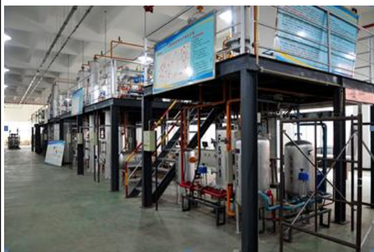
多晶硅生产虚拟工厂