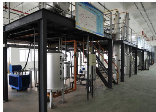
多晶硅生产核心设备实训室