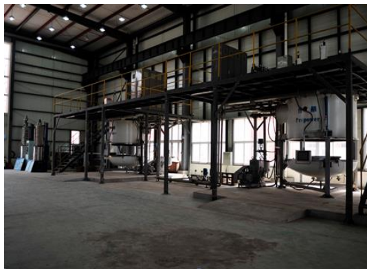
多晶硅铸锭生产车间

该专业校内实训应包括：多晶硅铸锭实训中心（坩埚喷涂车间、多晶硅铸锭生产车间、超纯水处理实训车间、直拉单晶生产实训车间）光伏材料检测实训中心（硅材料电性能检测实验室、硅片质量检测实训室、显微结构实训室）、多晶硅生产实训中心（多晶硅生产虚拟工厂、多晶硅生产虚拟仿真实训室、多晶硅生产核心设备实训室、化工管路拆装室）等。