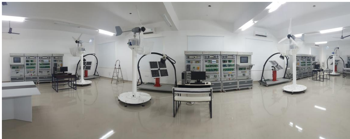
团队成员赴天津蓟州区开展服务乡村振兴实践行活动