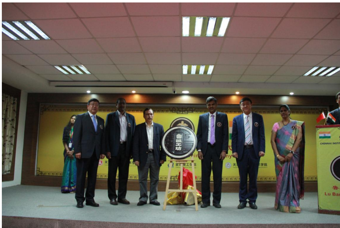
编写十三五规划教材—光伏技术应用