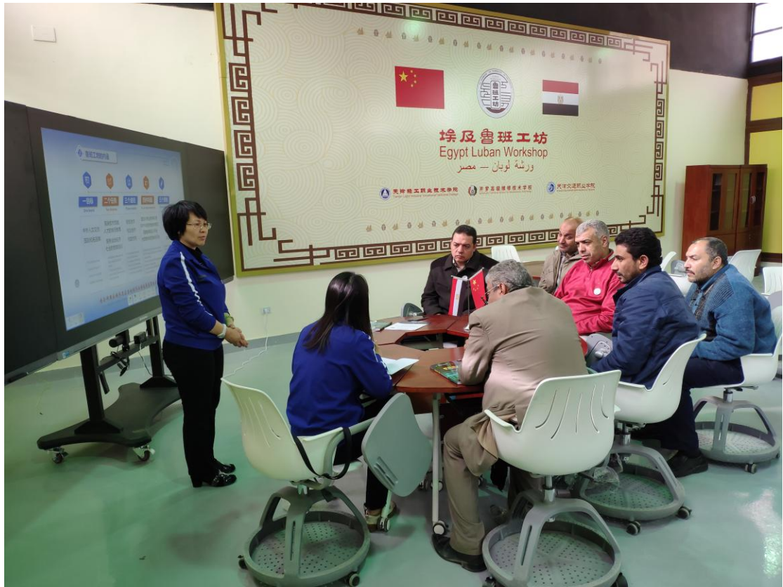
团队全体成员均为企业科技特派员为企业开展技术服务